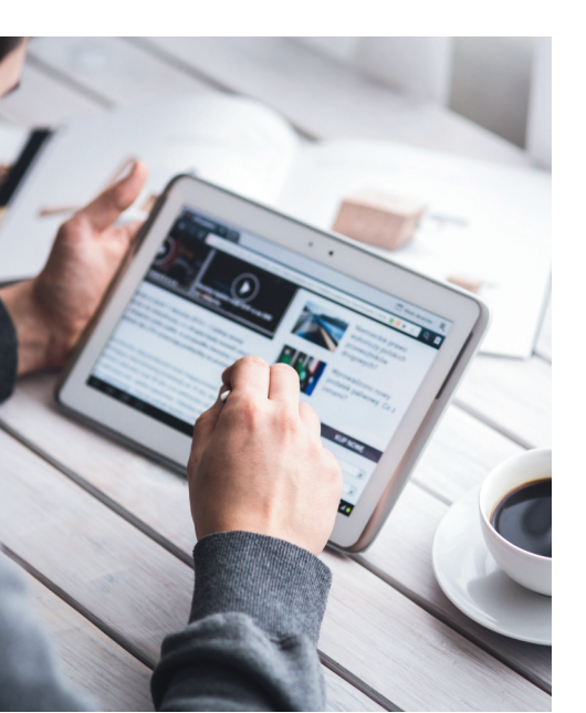
tabla de contenido